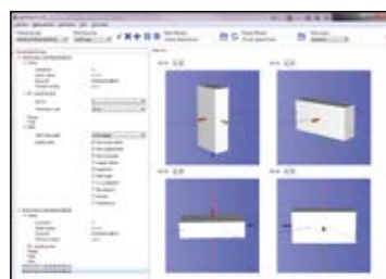
LpmsControl Utility Software